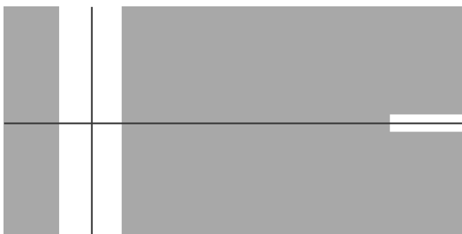
Figuur 1 Mikpunt heli category